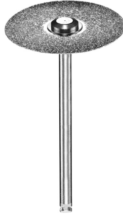
Elmas disk 10mm